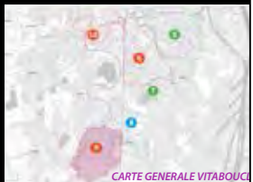
CARTE GENERALE VITABOUCE